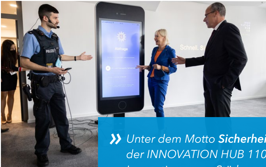
Die Hessische Digitalministerin Kristina Sinemus und der Hessische Innenminister Peter Beuth besuchen den INNOVATION HUB 110.

» Unter dem Motto Sicherheit neu denken arbeitet der INNOVATION HUB 110 gezielt an digitalen Innovationen zur Stärkung der Sicherheit. «